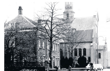
Voormalige pastorie met kerk

Ook op wereldlijk gebied was de pastoor een krachtige stuw en duwer. Zo maar een greep: In 1920 werd op zijn aandringen een stier uit de IJsselstreek aan-